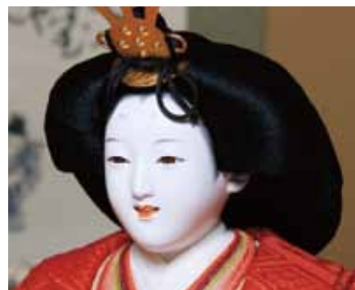
【おすべらかし】 江戸後期に完成された髪型。現代の皇室の行事に用いられます。