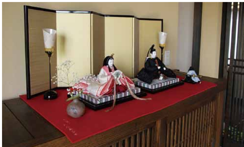
親王飾り 50,000円よりございます。 写真の品 200,000円(税別) (幅90cm×奥行45cm)

赤毛せんは病気・怪我のないようにとの魔除けの色。金は、色の頂点。豊かに実った稲穂、親の色。金屏風は、豊かで幸せな将来に希望を託す親の願いの象徴です。