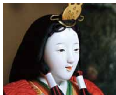
【古典下げ髪】 源氏絵巻にも見られる髪型。平安時代に誕生した日本古来の髪型です。