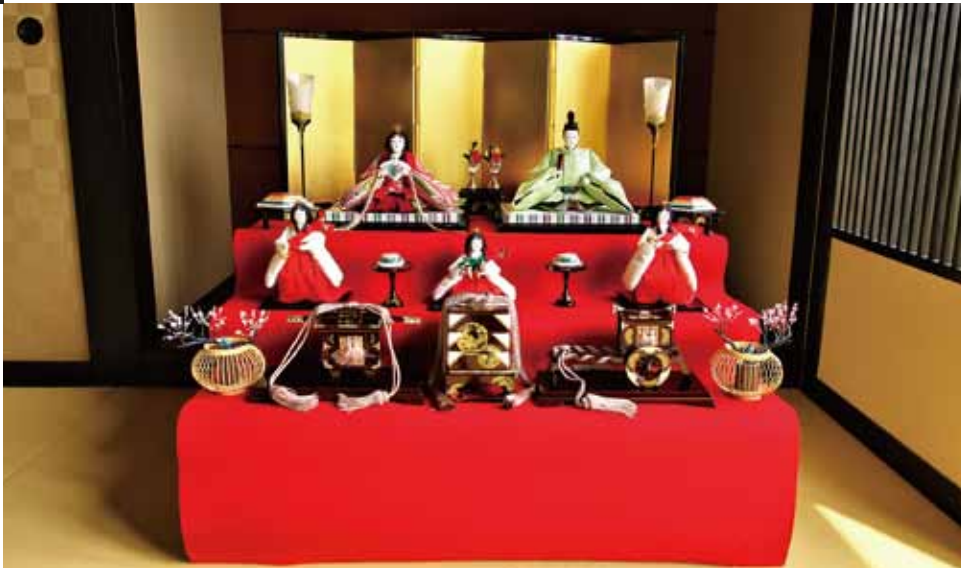
三段飾り 100,000円よりございます。 写真の品 300,000円(税別) (幅90cm×奥行80cm)

お子様にお人形に触れる喜びを味わってほしいとの思いから、お人形だけはケースに固定せずにご用意。